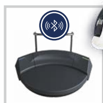
Bezdrátový nožní ovladač