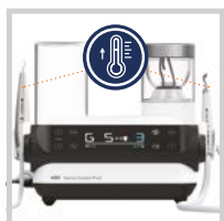
Systém ohřevu vody