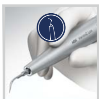
Tenký titanový násadec