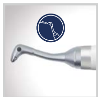
Jet tryska pro perio násadec