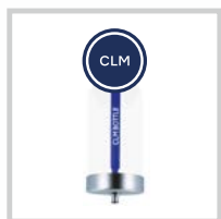
CLM-mód proti vytváření biofilmu